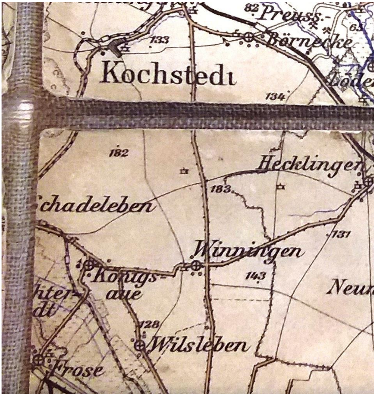
Kaisermanöverkarte 1903, Kartenauszug Plateau bei Cochstedt

Die dem König Karl I. verpflichteten Heerleute kamen entweder von Schöningen aus oder entlang der Saale von Memleben zum Heerestreffpunkt. Als möglicher Dritter Weg führt der Altweg von der Pfalz Paderborn entlang des nördlichen Harzrandes nach Osterwieck und Halberstadt, führt dann nach Gröningen zum Gröninger Weg, welcher über Cochstedt, Hecklingen so nach Staßfurt als Kammweg erscheint. Dieser direkte Weg von Paderborn aus als Altweg war Karl bestimmt bekannt.