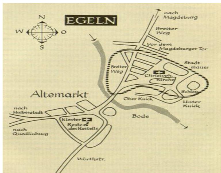
Egelu mit Resten des Kastells