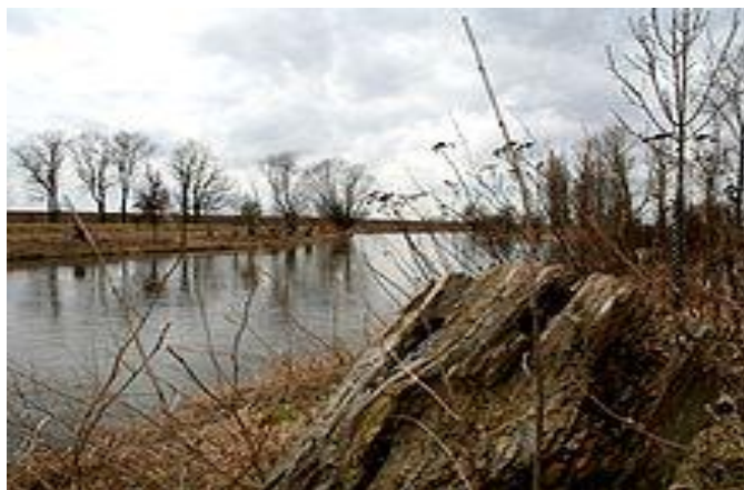
Bodefurt in Hohenerxleben

Der Kammweg an der Bode liegt außerhalb des Überschwemmungsgebietes der Bode und führt in eine fruchtbare Niederung, dem Bodebruch, welche durch die jährlichen fröhsommerlichen Überschwemmungen der Bode für gute landwirtschaftliche Erträge sorgte. Kommt der Reisende von Barby auf der nördlichen Seite der Saale und Bode oder von der südlichen Seite der Saale bei Aken kann er leicht ins nördliche Harzvorland reisen. Furten an der Bode hier waren Neugattersleben, Hohenerxleben und Staßfurt.